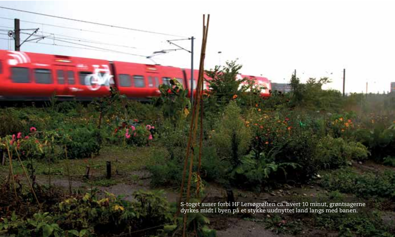
S-toget suser forbi HF Lersøgrøften ca. hvert 10 minut, grøntsagerne dyrkes midt i byen på et stykke uudnyttet land langs med banen.

I HF Lersøgrøften er der ingen hække mellem haverne, og det er helt bevidst. Når hækken ikke er fysisk eksisterende, er den det heller ikke i overført