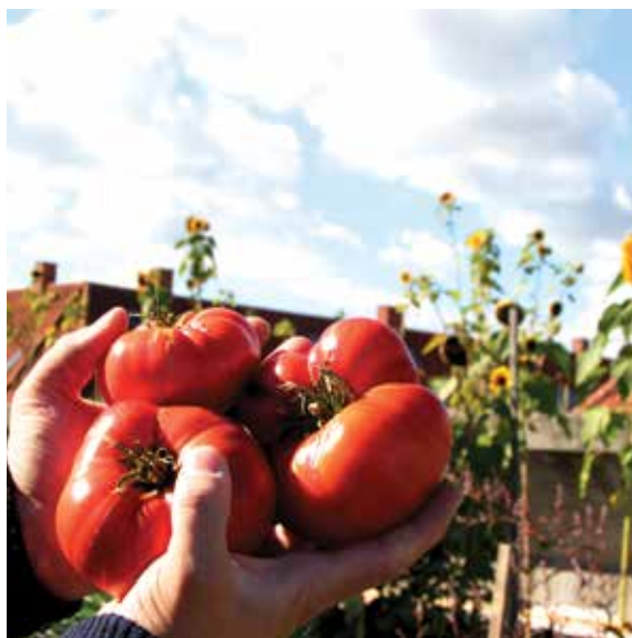
Dagens høst af tomater fra DYRK-Nørrebro.