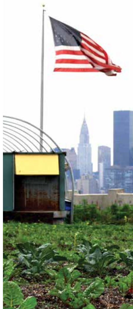
Traditionen med taghaver kommer fra New York. Her ses en taghave med udsigt over Manhattan.